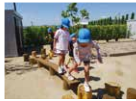
落ちないように、慎重に一歩ずつ

年齢一律で区切らず、個々の発達や興味に寄り添う同園制作活動では難易度の異なる選択肢を用意し、子ども自身が「挑戦したいレベル」を選べるようにしています。「この年齢には難しい」と枠にはめず、一人ひとりの意欲と熱意を大切に引き出す環境づくりが、子どもたちの主体性を豊かに育んでいます。」