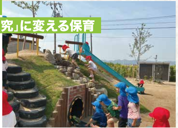
自ら登り、考える外遊びの時間