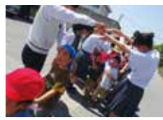
お兄さんお姉さんと、なかよし交流

地域との絆が強い藤田地区。近隣の興陽高校とは年5回の交流を予定しており、5歳児が農業科で高校生と野菜の苗を選んだり、保育士を目指す生徒が園を見学したりしています。近隣住民からも「畑をやるなら声かけて！」と手が差し伸べられるなど、地域全体で子どもたちを育み、世代を超えて学び合う関係が生まれています。