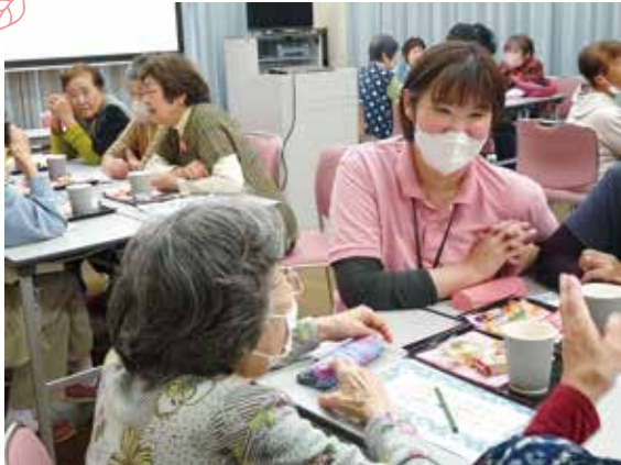
お茶とお菓子を囲み、自然と会話も弾みます