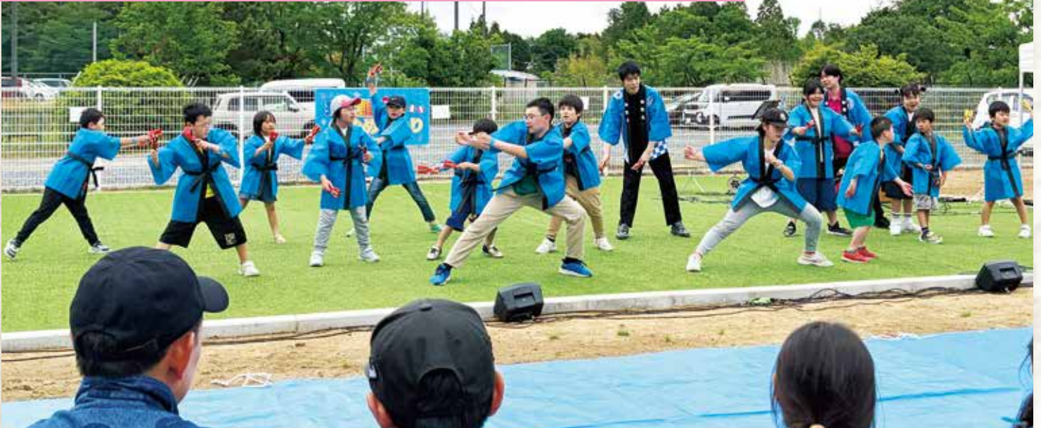
ステージでは夢門塾の子どもたちが迫力のよさこいを見せます!