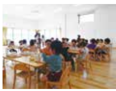
自分で選んで食べる、共食の場

異年齢が共に食事を楽しむランチルームでは、席やカトラリー、食べる量を子ども自身で選択します。カレーの日には箸を選んで食べにくくても、大人は先回りしません。自分で「スプーンの方がいい」と気付くプロセスを失敗ではなく「探究」と捉え、日々の食を通じて自ら考え行動する力を育んでいます。