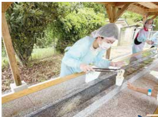
御影石のそうめん流し! 初夏の陽気で汗ばむ体に冷えたそうめんがたまりません。