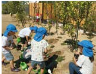
大きなあれ、みんなの苗植え

大人が先回りして失敗を遠ざけると、子どもの問題解決力は育ちません。きらめき六区こども園が大切にしているのは、子どもたちの「主体性」です。園長の荻野先生は「大人が教えるのは簡単ですが、自分で気付き、友達と教え合う過程を大切にしたい」と語ります。日々の経験から自ら考え、気付き、次にどう行動すべきかを自分たちで導き出せるよう、大人が手を出さず見守る保育を何よりも重んじています。