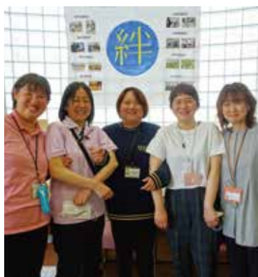
居場所づくりを目指して活動する、温かいスタッフ

介護福祉サービス「ゆうゆう」が地域向けに開く「ゆうゆうcafe」。認知症のある方やご家族、地域の大人も子どもも、お茶を飲みながら気軽に語り合える場です。4月の第4火曜、福山市新市町の「あびきふれあいプラザ」で開催された「ゆうゆうcafeあびき」を訪問。5力所ある中でも参加者が最も多く、温かな交流が広がっていました。