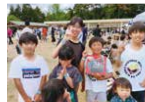
昨年に引き続き、おたのしみ抽選会では豪華景品が当たるとあって、多くの子どもたちがわくわく顔で集まりました。

🏠 グルメも遊びも満載、笑顔あふれる会場に 会場には地元キッチンカーが並び、料理やスイーツを楽しむ人の姿も。無料ゲームや抽選会、握力測定、縄跳び記録会など親子で楽しめる企画も充実。友達の記録を称え合う子どもたちの姿に、会場は温かな空気に包まれました。