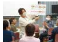
リズムに合わせて言葉を繋ぐ、楽しい口腔体操

参加者からは「毎月の楽しみ」「健康の話も聞けてお得」といった声も。後半はイスに座ったままの体操や、口腔機能を高めるゲームで笑顔に。最後は「楽しかった」「また来月」と、あたたかな雰囲気の中で終了しました。