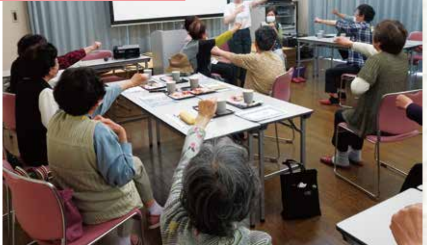
椅子に座ったまま、体を動かしてリフレッシュ