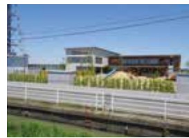
のどかな田園に佇む、新しい園舎

きらめき六区こども園では、生後57日目から就学前までの児童を対象に、時代を見据えた新しい保育を実践しています。園が特に重視しているのは、子どもたちが自ら考えて行動する「主体性」や、他者と関わる「コミュニケーション力」です。これからの時代に必要とされる「人間ならではの力を大切に育んでいます。」