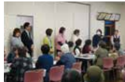
プライベートなネタも満載のスタッフ自己紹介

受付で名前と希望の飲み物を記入し、参加費100円を支払って好きな席へ。10時になると「ゆうゆうcafeあびき」が始まりました。参加者は42名。スタッフの自己紹介では、誕生日や髪型、宝塚観劇の話などが飛び出し、会場は「気に和やかな空気」に包まれました